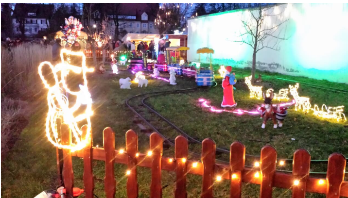
Kindereisenbahn - © Lionsclub Tirschenreuth